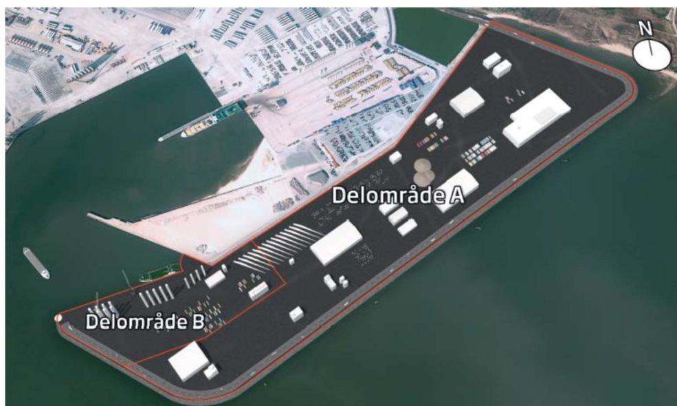
Figur 1.4 Delområder på Etape 5.

Nær ved kajerne i delområde B vil der i perioderne mellem udskibninger kunne ske opstilling af højt projektgods, svarende til det nuværende oplag af cirka 90 meter høje vindmølletårne nær kajer på Esbjerg Østhavn. Det forudses, at højden på vindmølletårne stiger i fremtiden. Derfor indeholder delområde B mulighed for højt oplag i tilknytning til udskibning fra Aquariuskaj. I delområde A må oplag ikke overstige den maksimale bygningshøjde på 30 m.